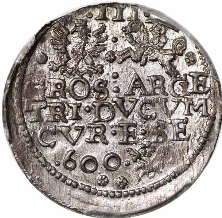
248 Ks. Kurlandii i Semigalii Wilhelm Kettler trojak 1600